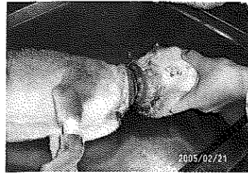
左營橡皮筋狗小黃